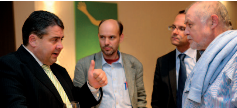
Sigmar Gabriel im Gespräch mit Bürgern und Kreisrat Gernot Gruber zum Thema notwendige Konsequenzen aus der Finanzmarktkrise